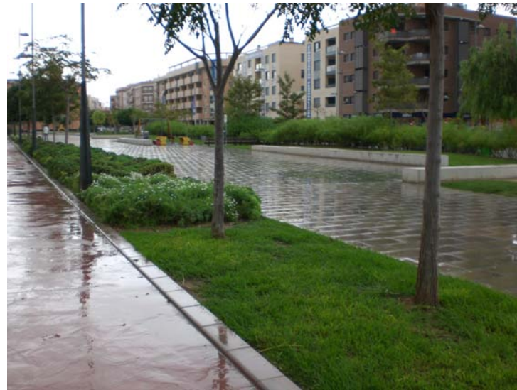
Av. Vte. Savall