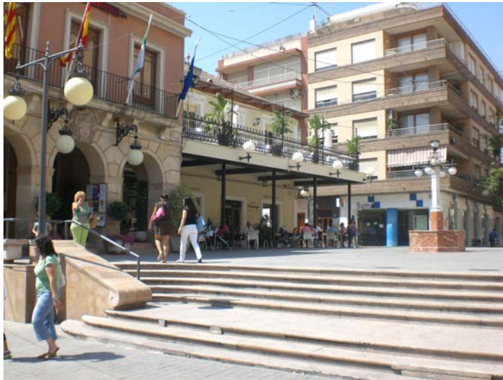
Plaza de España