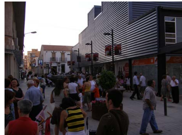
Calle San José