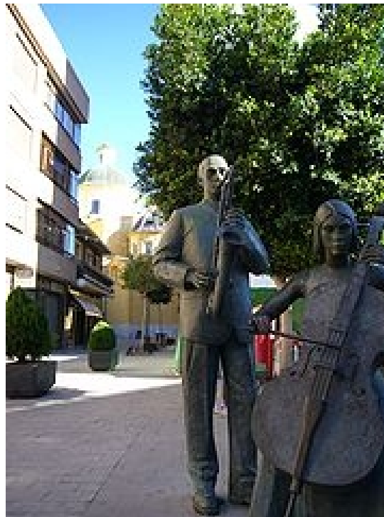
Calle General Prim