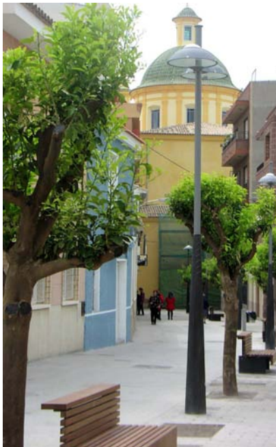
Calle Lillo Juan