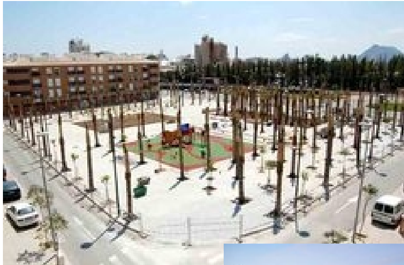
Apeadero y alrededores