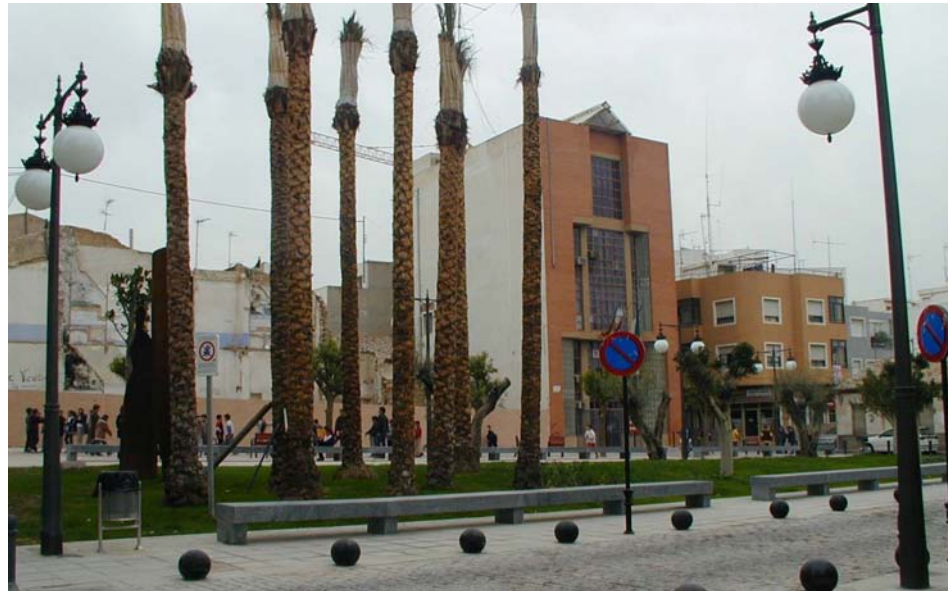
Plaza del Pilar