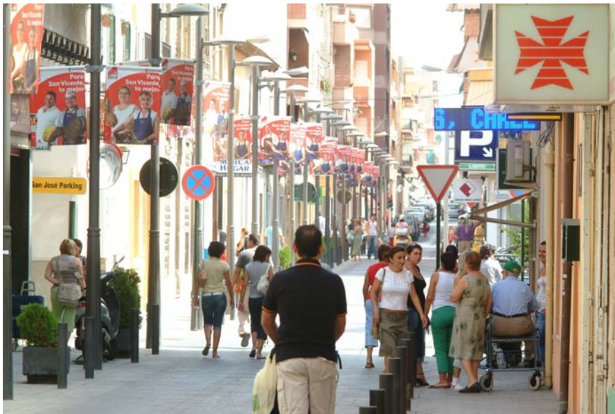
Calle Domínguez Margarit