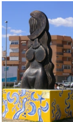
Escultura Dona Lluna